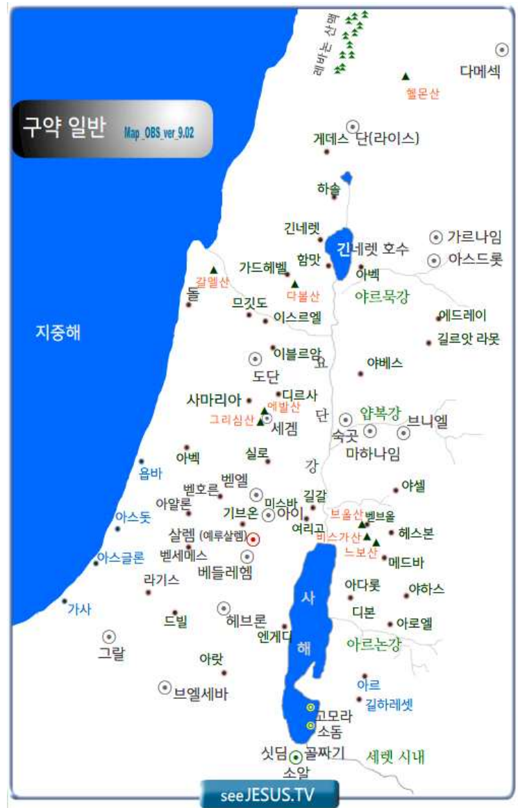
[ 구약 일반 지도 ] ver_9.02

더 이상 나오미는 룯을 거절할 수 없었다. 이 여인은 시어머니를 따라 베들레헴으로 들어가 라합과 살몬 사이에서 낳은 보아스를 만나 결혼했다. 이 여인은 오벳을 낳았고 오벳은 위대한 다윗을 낳았다. 룯은 나오미에게 “어머니의 백성은 내 백성이 되고 어머니의 하나님이 나의 하나님이 되시리니”라고 말한 것처럼 하나님께서는 그녀의 믿음대로 그녀를 예수님의 조상으로서 존귀한 자리에 올려놓으셨다